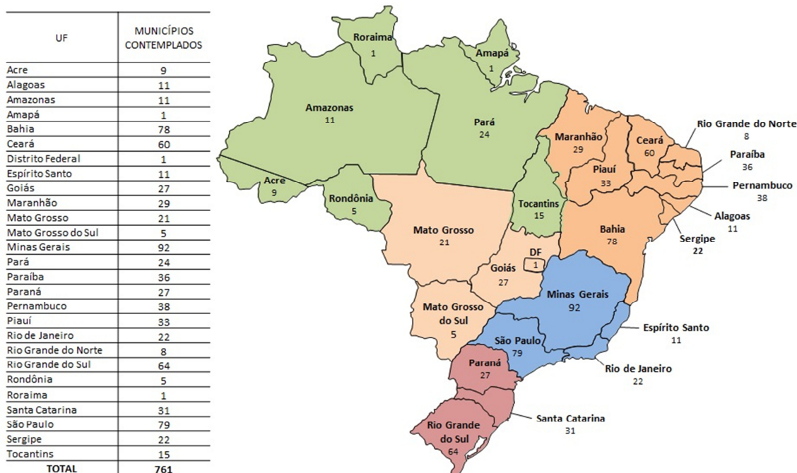
FIGURA 02 – MUNICÍPIOS CONTEMPLADOS NO PNO